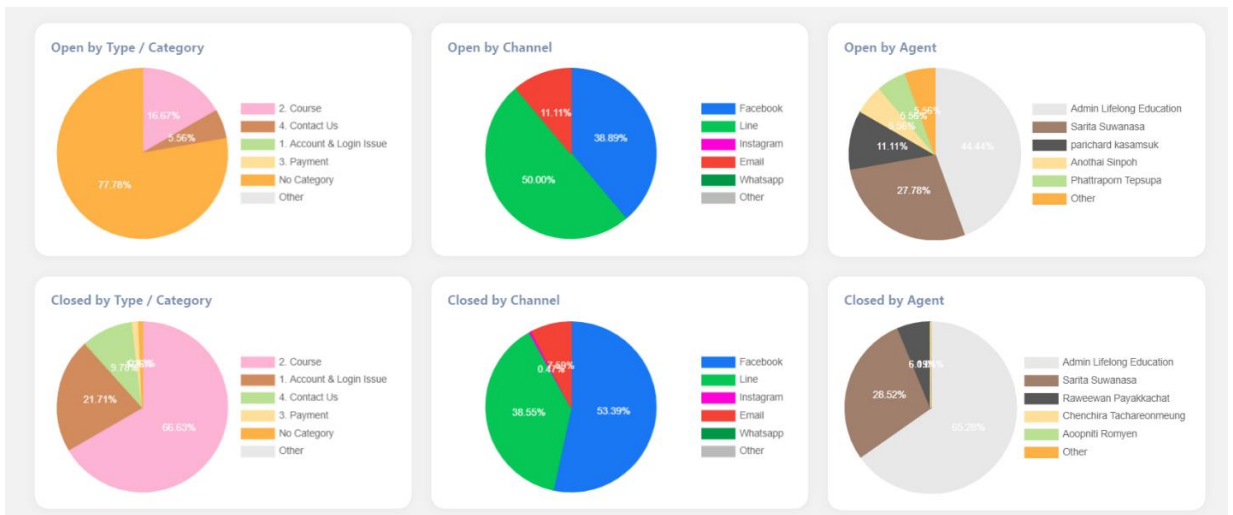
ภาพแสดงสัดส่วนการรับบริการ จำแนกตามช่องทางการให้บริการ ประจำปี พ.ศ. 2566

หัวข้อการติดต่อผ่านช่องทาง (E-service) ที่มากที่สุด ได้แก่ การสอบถามเกี่ยวกับหลักสูตร มีจำนวนการรับบริการ 4,873 ครั้ง คิดเป็นร้อยละ 66.63