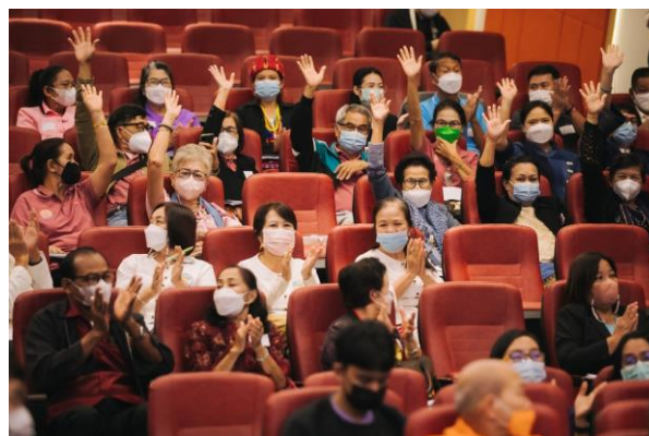
กิจกรรมอบรมเชิงปฏิบัติการ “เสริมสร้างทักษะวิทยากรความรู้ “มีดี” ในโรงเรียนผู้สูงอายุภาคเหนือ”